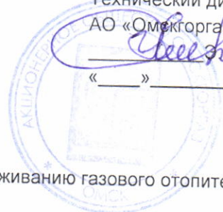
График выполнения работ СВС-3 АО «Омскгоргаз» по обслуживанию газового отопительного оборудования (газовых котлов)