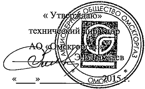
График выполнения работ СВС-1 АО «Омскгоргаз» ТО ВДГО на 2016 г.