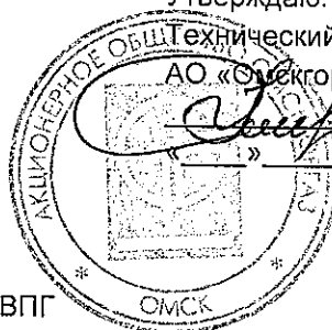
График выполнения планового технического обслуживания ВПГ (Водонагреватель Проточный Газовый) на 2016 год