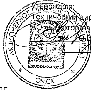
График выполнения планового технического обслуживания ВПГ (Водонагреватель Проточный Газовый) на 2016 год