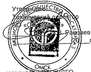
График выполнения работ по ВС-3 АО «Омскгаз» по ТО ВДГО (ежегодное) и ПТО ВДГО (трехгодичное) на домах Управляющей компании ООО "Коммунсервис" На 2016 год