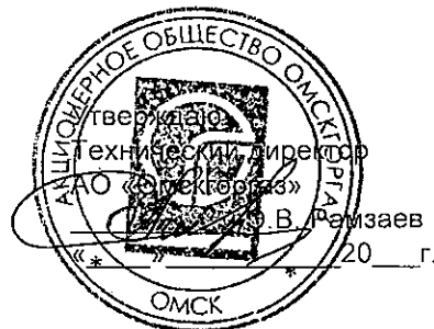
График выполнения работ СВС-3 АО «Омскоргаз» по ТО ВДГО (ежегодное) и ПТО ВДГО (трехгодичное) на домах ООО "ЖКО "Московка"