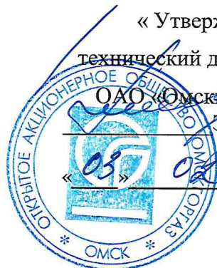
График выполнения работ СВС-1 ОАО «Омскорггаз» ПТО и ТО ВДГО на 2015 г.