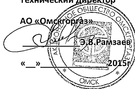
График выполнения работ СВС-2 АО «Омскгаз» по ТО ВДГО (ежегодное) и

ПТО ВДГО (трехгодичное) на домах Управляющей компании ООО «Триод»