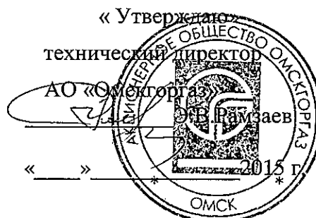
График выполнения работ СВС-1 АО «Омскгоргаз» ПТО и ТО ВДГО на 2016 г.