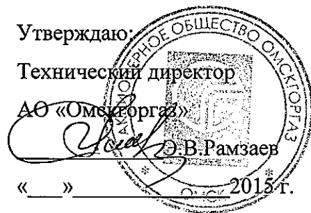
График выполнения работ СВС-2 АО «Омскгаз» по ТО ВДГО (ежегодное) и ПТО ВДГО (трехгодичное) на домах ООО «Весна-1» на 2016 год