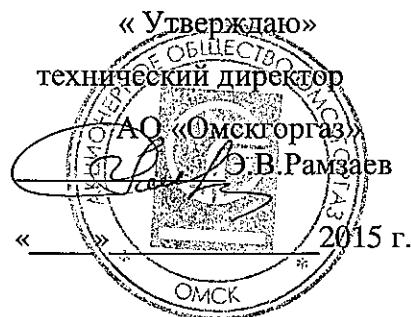
График выполнения работ СВС-1 АО «Омскгоргаз» ПТО и ТО ВДГО на 2016 г.