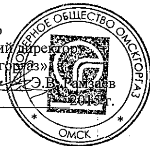
График выполнения работ СВС – 2 АО «Омскгаз» по ТО ВДГО (ежегодное) и ПТО ВДГО (трехгодичное) на домах Управляющей компании Молодёжный – 3 ЖСК на 2016 год