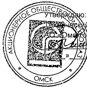
График выполнения работ СВС-3 АО «Омскгаз» по обслуживанию газового отопительного оборудования (газовых котлов)